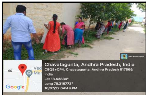
Fig: Clean and Green program monitoring by the Principal and CSP coordinator