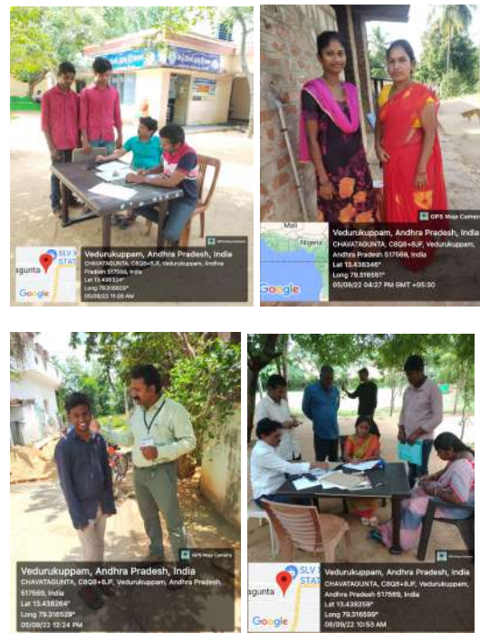
Fig: Admission drive by the teaching staff

enhance the admissions for the academic year 2022-23.