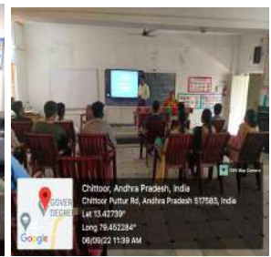
Fig: Guest lectures by the college teaching staff