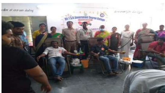
Fig : Glimpse of the Blood Donation Camp The event for this noble cause was

In its unwavering commitment to serve the community, Dr YSR GDC, Vedurukuppam organized a Blood Donation Camp in the college premises on 17th of September, 2022 in association with NTR Trust Center, Tirupati.