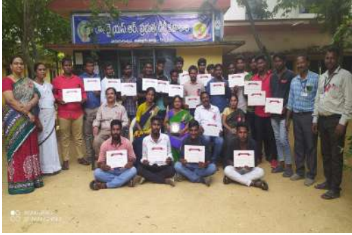
Fig: Certification of the Blood Donation Camp.

About 31 units of blood was collected on the day. Finally , certificates were given to 50 blood donors belonging to the college so as to end up the program.