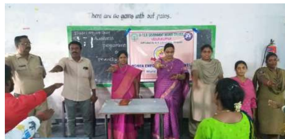
Fig:Glimpses of the World Suicide Prevention Day