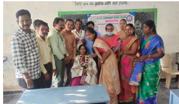
Fig:Glimpses of the Teachers Day Celebration