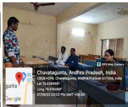
Fig: Community service project evaluation for 2nd year students by the college teaching staff