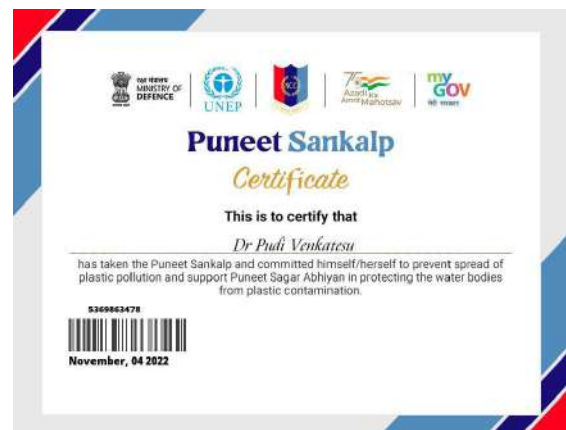
Figs: The above are glimpses showing various awareness programs attended and participated in by the college teaching faculty in the month of November, 2022.