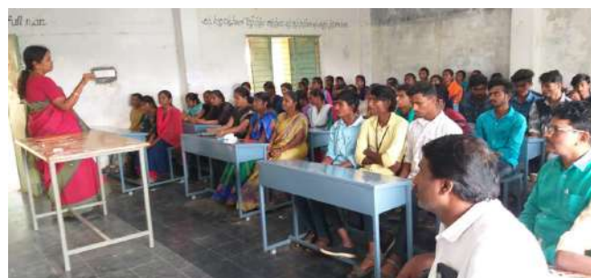
Fig. 1. Glimpses of the Student Induction Program