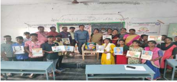
Fig: Glimpses of the National Constitution Day