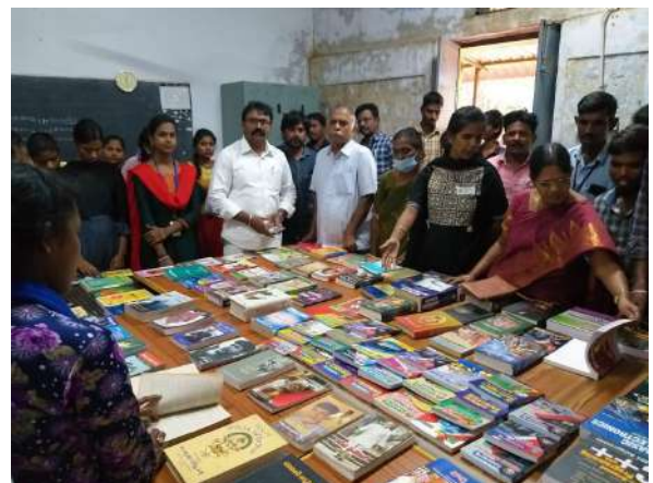
Fig: shows a preview of the library exhibition on November 19. held at GDC, Vedurukuppam.

Activity starts with showing and explaining the library's resources and facilities to all freshmen students as a part of the induction program proposed by CCE. After that, everyone is given a guided tour around the library book exhibition to get familiar with the various books available in the library.