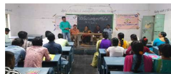
Fig: Dept. of Telugu faculty speaking in program