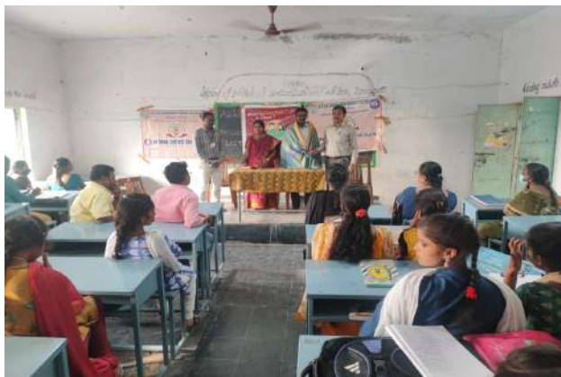
Fig: glimpses of the program on Electoral Rolls Finally, the college principal honored the MRO with saliva and compelled all the students to enroll on the electoral roll.