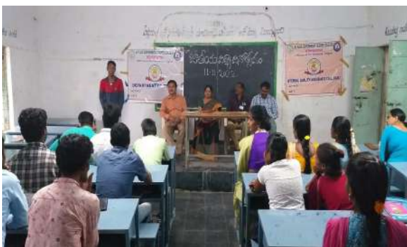
Fig. Student participation in the program

National Education Day/Minorities Welfare Day is an annual observance in India to commemorate the birth anniversary of Maulana Abul Kalam Azad, the first Education Minister of independent India, who served from August 15th, 1947, until February 2nd, 1958. This is celebrated on November 11 every year to remember Maulana Azad's contribution in laying the foundations of the education system in an Independent India.