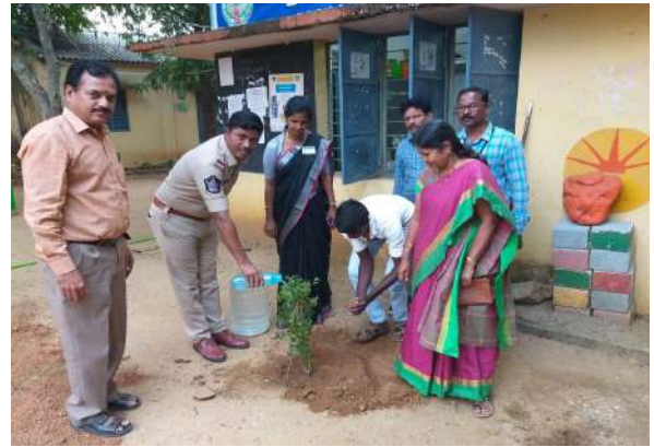
At the end of the program, a tree was planted by the inspector as a tribute to the college