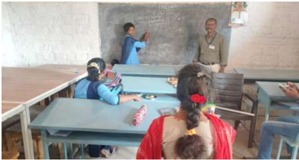
Fig: a visit to the NAS program by IQAC coordinator along with MEO in nearby schools such as at Socrates Devalampeta