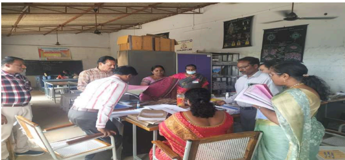
Fig. 2: Academic advisors audited the science departments (phy., zoo., bot., & chem.)