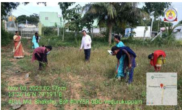
Fig: Botanical field work on weed diversity by 2nd BZC students.

These examinations served as a crucial evaluation point for students, allowing them to demonstrate their understanding and mastery of the subjects they have been studying.