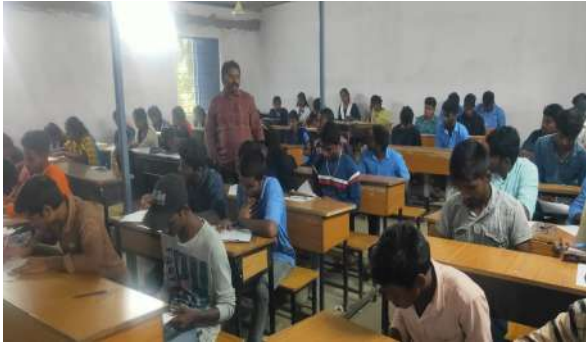
Fig: Mid Exam by Dept. of Teludu