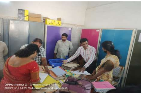
Fig.4: Arts Department Files Verification by Academic Advisors