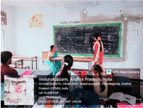
Fig: Seminar given by P.Suneetha IIBZC Topic - Derivation of Beer- Lbert law.

These examinations served as a crucial evaluation point for students, allowing them to demonstrate their understanding and mastery of the subjects they have been studying.