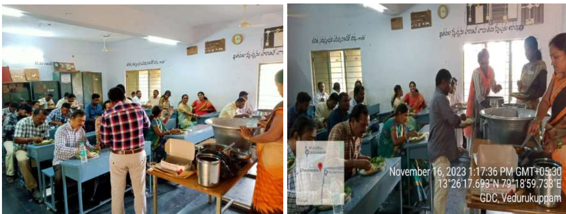
Fig.1: Lunch was arranged by staff club of Dr YSR GDC, Vedurukuppam

actionable recommendations. This introspective exercise promises to refine the college's academic landscape, ensuring that Dr. Y.S.R. Government Degree College continues to provide its students with an education that is both enriching and empowering.