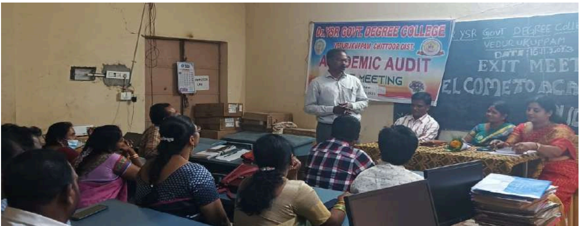
Fig.5: Speeches by Principal, Vice Principal, Academic Advisors and IQAC coordinator