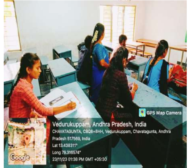
Fig: Online Quiz by Dept. of Chemistry to V Semester BZC Students