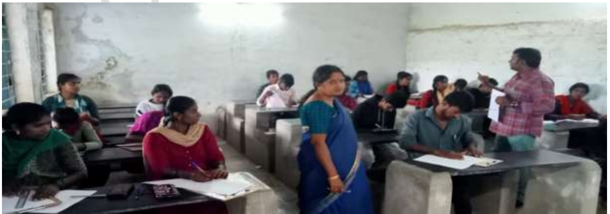
Fig: Mid term examination-1 conducted by the Telugu department for the First Year degree students and visited by our Honorable Principal madam.