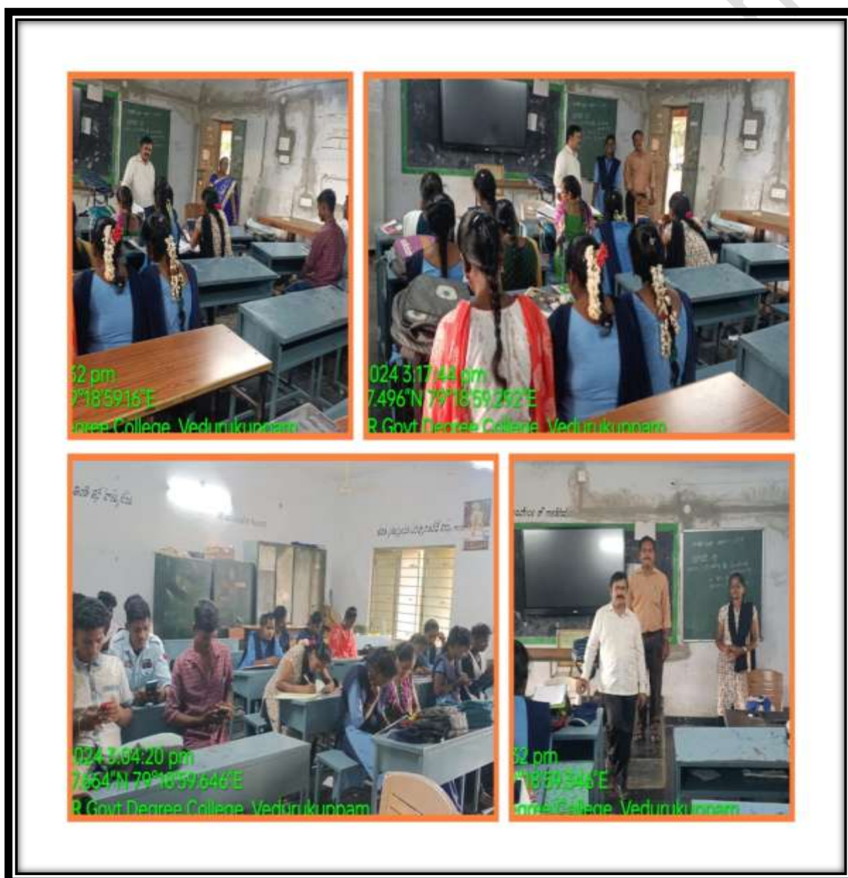
Fig: Department of Botany and Chemistry conducted a Debate on Food security and genetically modified crops in achievement of Swarnandhra Pradesh. Students' opinions on modern trends in agriculture to combat food supply towards increasing population.

Dr. YSR Government Degree College, Vedurukuppam (YSRGDC), is committed to providing a holistic educational experience that fosters both academic excellence and personal growth. This report offers a comprehensive overview of the various curricular and co-curricular activities undertaken by the college, including admission drives, the Clean and Green program, sports, and internship-evaluation.