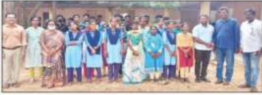
విద్యార్థులకు అవగాహన కార్యక్రమం నిర్వహిస్తున్న వ్యక్తులు