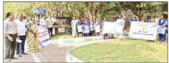
తిరుపతి ఎన్.కస్తూరి విద్యార్థులకు అవగాహన కల్పిస్తున్న అధ్యాపకులు

విద్యార్థులకు సైన్స్ పట్ల అవగాహన కల్పించడం జరిగిందని వివరించారు. కార్యక్రమంలో జంతుశాస్త్ర, రసాయన శాస్త్రం, వృక్షశాస్త్రం, గణితశాస్త్రం, కంప్యూటర్ సైన్స్ తదితర హెడ్ ఆఫ్ డి.డి.పార్ట్మెంట్లు పాల్గొని విజయవంతం చేశారని చెప్పారు. కళాశాల అవుట్స్పీర్సింగ్ సిబ్బంది ఎన్.కస్తూరి విద్యార్థినులకు మార్గదర్శకత్వం చేశారని తెలిపారు.