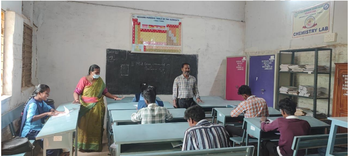
Fig: Mid-term examination-II conducted by the Telugu department for the First Year degree students and visited by vice- Principal madam.