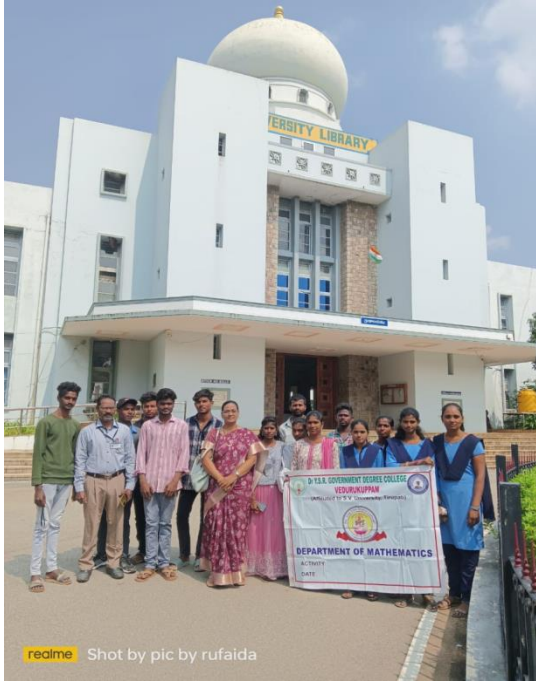
realme Shot by pic by rufaida