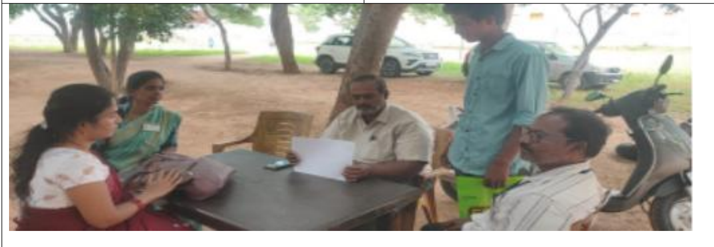
Fig: Admission Drive: Faculty and student volunteers visited nearby villages to counsel students on courses and scholarships.

The Department of Botany organized an outreach program focusing on biodiversity awareness and environmental conservation. Students conducted plantation drives and educated school children on the importance of maintaining green spaces. The activity reflected the department's ongoing commitment to sustainability and community service.