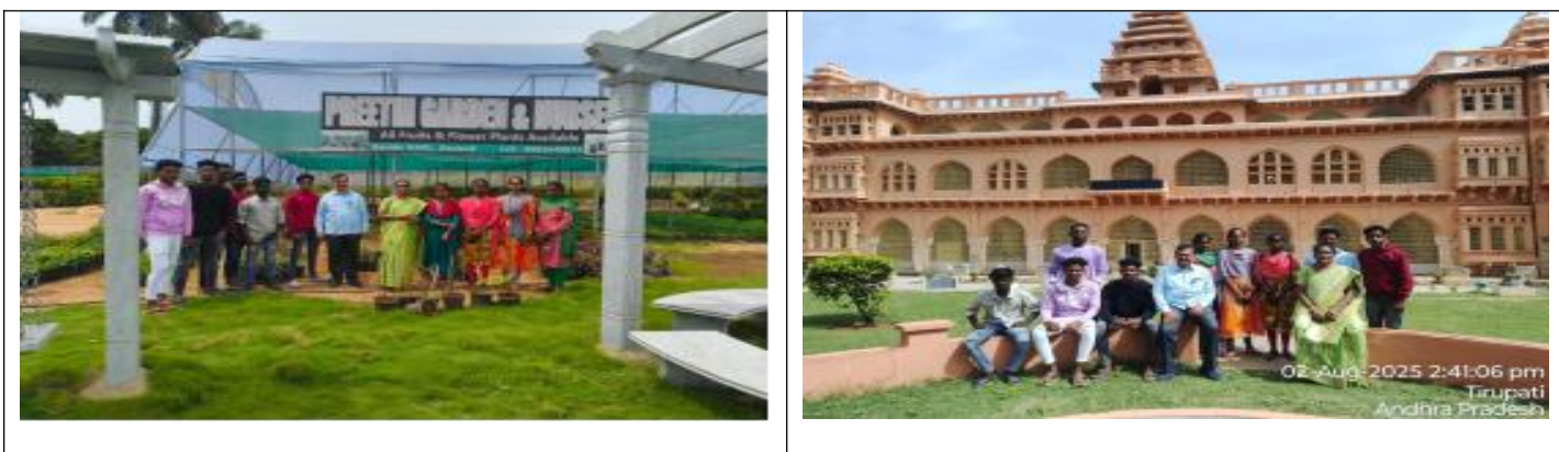
Fig: Outreach Program by Department of Botany: Visit to Industrial exposure for students

The Department of Botany organized an outreach program focusing on biodiversity awareness and environmental conservation. Students conducted plantation drives and educated school children on the importance of maintaining green spaces. The activity reflected the department's ongoing commitment to sustainability and community service.