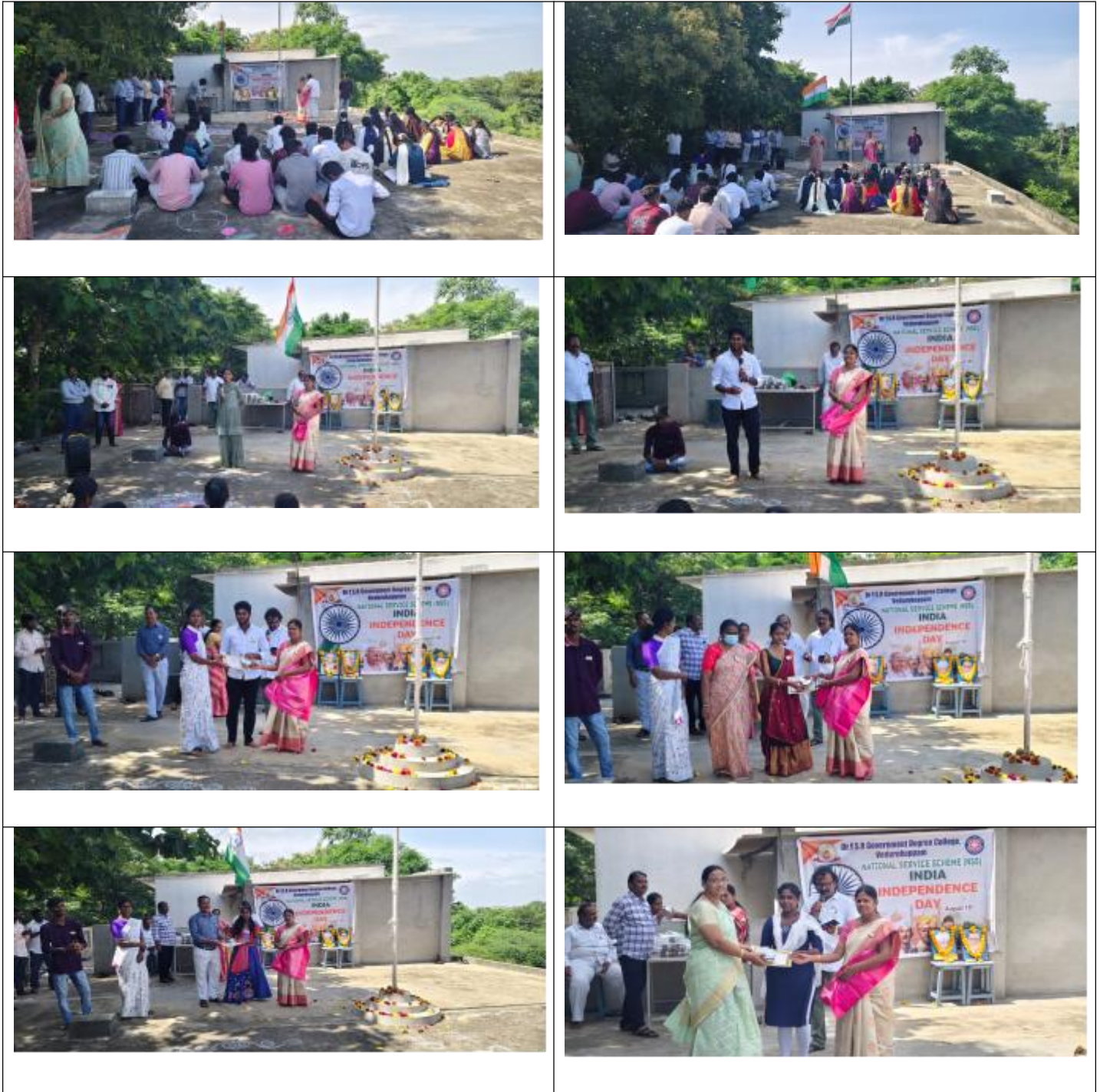
Fig: Independence day celebrations with speeches and distribution of prizes

Dr. YSR Government Degree College, Vedurukuppam, celebrated the 79th Independence Day with great patriotism and enthusiasm. The tricolor was hoisted by the Principal, followed by the national anthem. Faculty and students participated in a parade and cultural performances themed on India's freedom struggle and unity in diversity. The Principal's address emphasized the importance of freedom, discipline, and national responsibility. Prizes were distributed to winners of essay, elocution, and painting competitions organized by the NSS and Cultural wings. The event concluded with a pledge to uphold the values of democracy and peace.