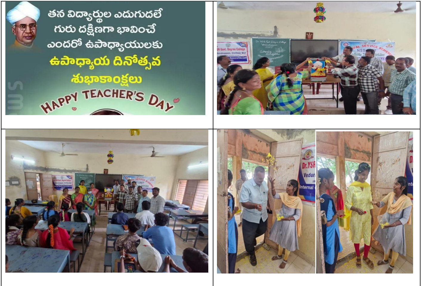
Fig: Teachers' day celebrations with honors

The Principal and IQAC Coordinator appreciated the initiative taken by the students and commended the efforts of the teaching staff for their continued commitment to quality education and holistic student development.