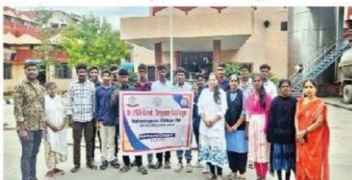
తిరుపతి బాలాజీ డెయిరీ క్షేత్ర పర్యటనలో డిగ్రీ కళాశాల విద్యార్థులు