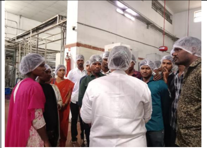
Fig:Outreach Program by Department of Economics: Visit to Industrial exposure for students