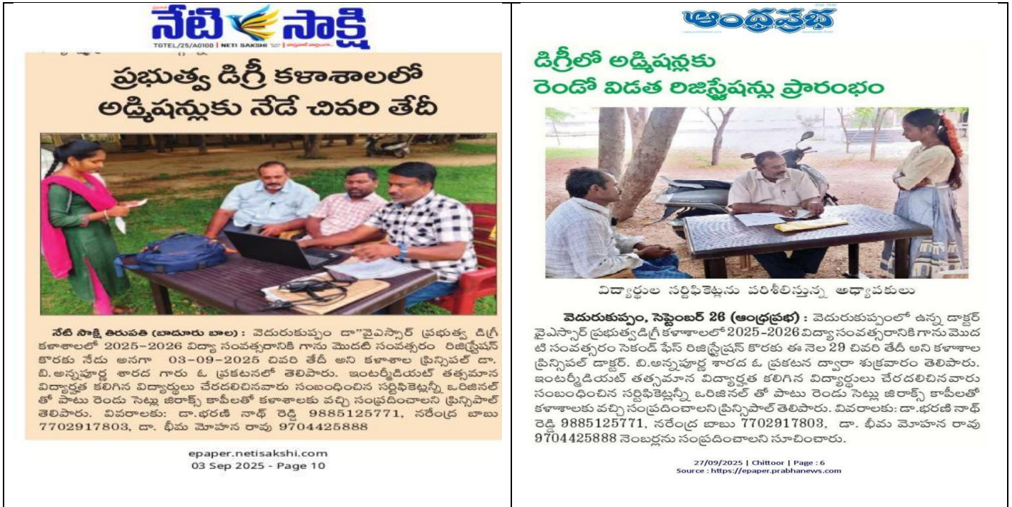
Fig: Admission Drive: Faculty and student volunteers visited nearby villages to counsel students on courses and scholarships.

The college conducted an extensive admission drive to encourage enrollment for the academic year 2025-2026. Faculty and student volunteers visited nearby villages to counsel students on course offerings, scholarships, and career opportunities. The initiative successfully attracted new admissions, especially among rural youth, promoting inclusive education.