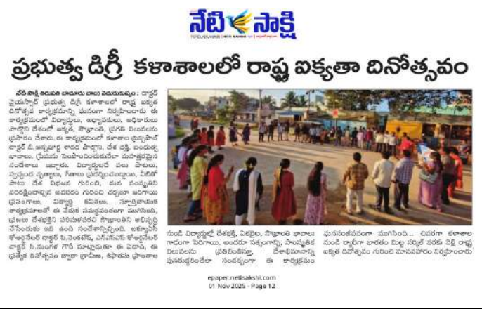
Fig: National Unity Day Celebrations