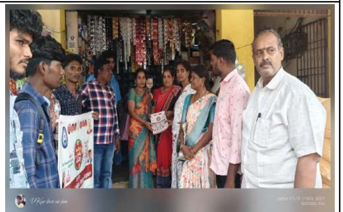
Fig: GST-2.0 Canvassing