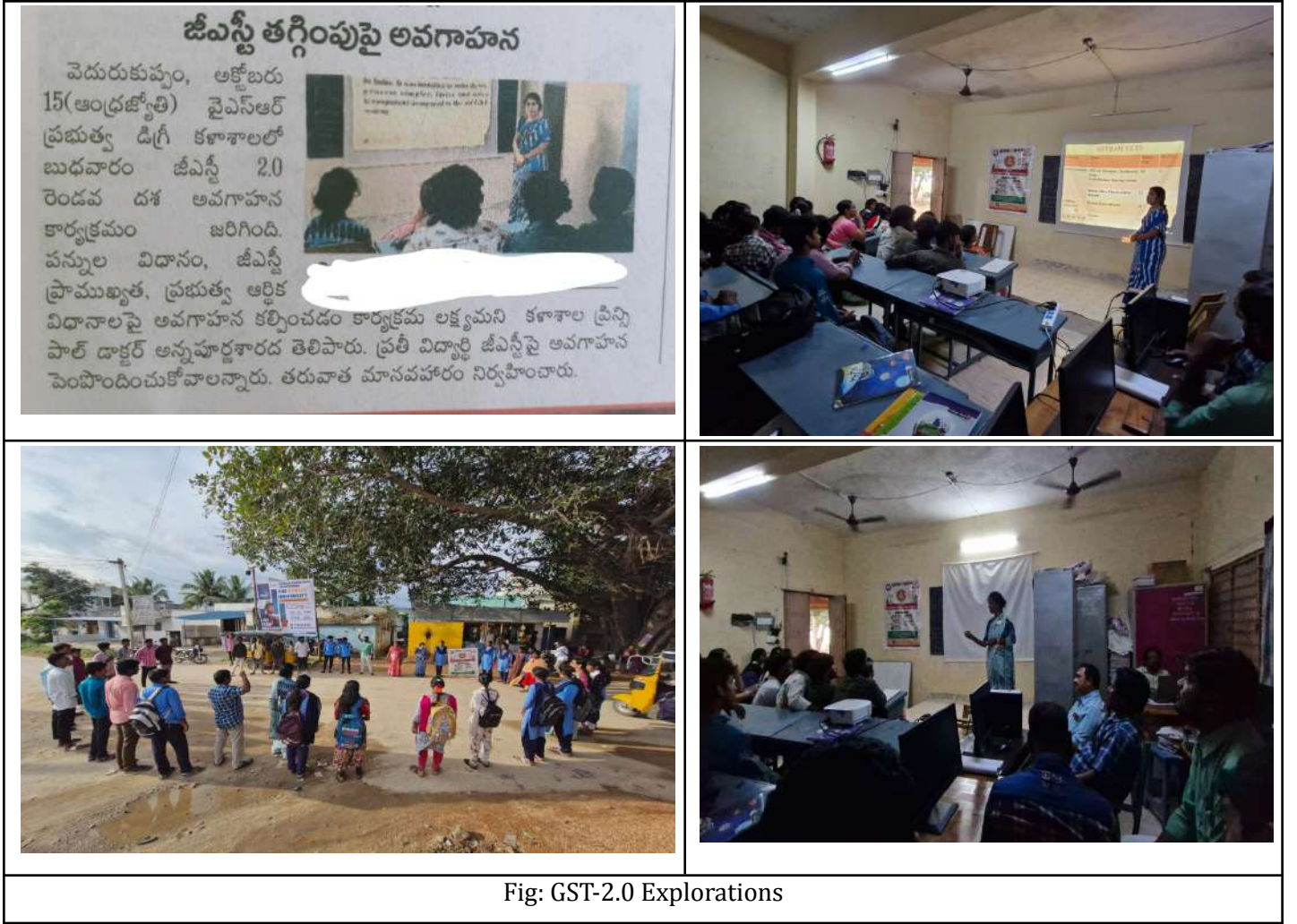
Fig: GST-2.0 Explorations