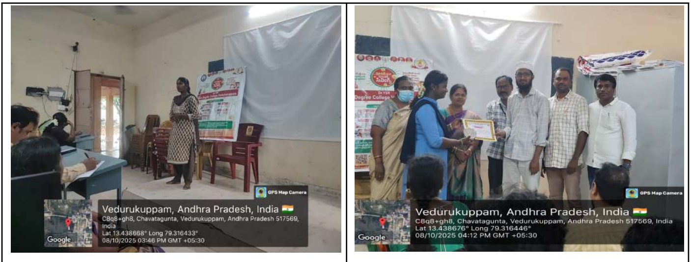
Fig: GST 2.0 celebrations