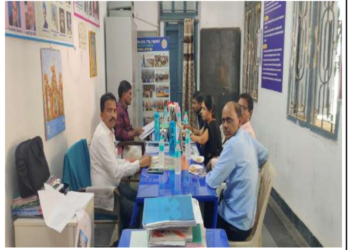
Fig: Admission Drive & Faculty attended BOS meetings

ఈనాడు, అమరావతి: తుపాన్ కారణంగా డిగ్రీ మూడో విడత ప్రవేశాల కొన్సాలింగ్ను ఉన్నత విద్యా మండలి సవరించింది. రిజిస్ట్రేషన్లకు ఈనెల 29 వరకు గడువు ఇచ్చింది. ద్రువపత్రాల అప్లోడింగ్ నవంబరు 1, పత్రాల పరిశీలన, వెబ్ ఐచ్ఛికాల నమోదు 2 వరకు అవకాశం పొడిగించింది. వెబ్ ఐచ్ఛికాల మార్పు 3న, సీట్లు కేటాయింపు 4న చేయనున్నట్లు పేర్కొంది. సీట్లు పొందిన అభ్యర్థులు నవంబరు 7లోపు కళాశాలల్లో చేరాల్సి ఉంటుందని వెల్లడించింది.