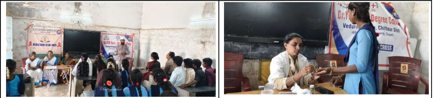
Fig: Blood group Testing by RRC & YRC

On Monday, November 24th, 2025, our campus health initiatives took center stage as the Red Ribbon Club (RRC) and the Youth Red Cross (YRC) successfully organized a crucial Blood Group Testing Camp . This event saw enthusiastic participation from students and faculty, reflecting a strong commitment to health awareness and community responsibility. The aim of the camp was simple yet vital: to ensure every member of our college community knows their specific blood type, which is a piece of information that can literally save a life.