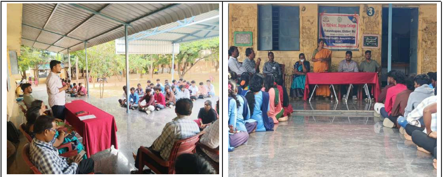
Fig: Awareness on Intership by the college principal & Sattva infotech propritor

We were honored to have the Proprietor of Sattva Infotech as our guest speaker. As a leader in a top IT solutions and technology training firm, they provided a "view from the trenches" regarding what employers actually look for in interns.