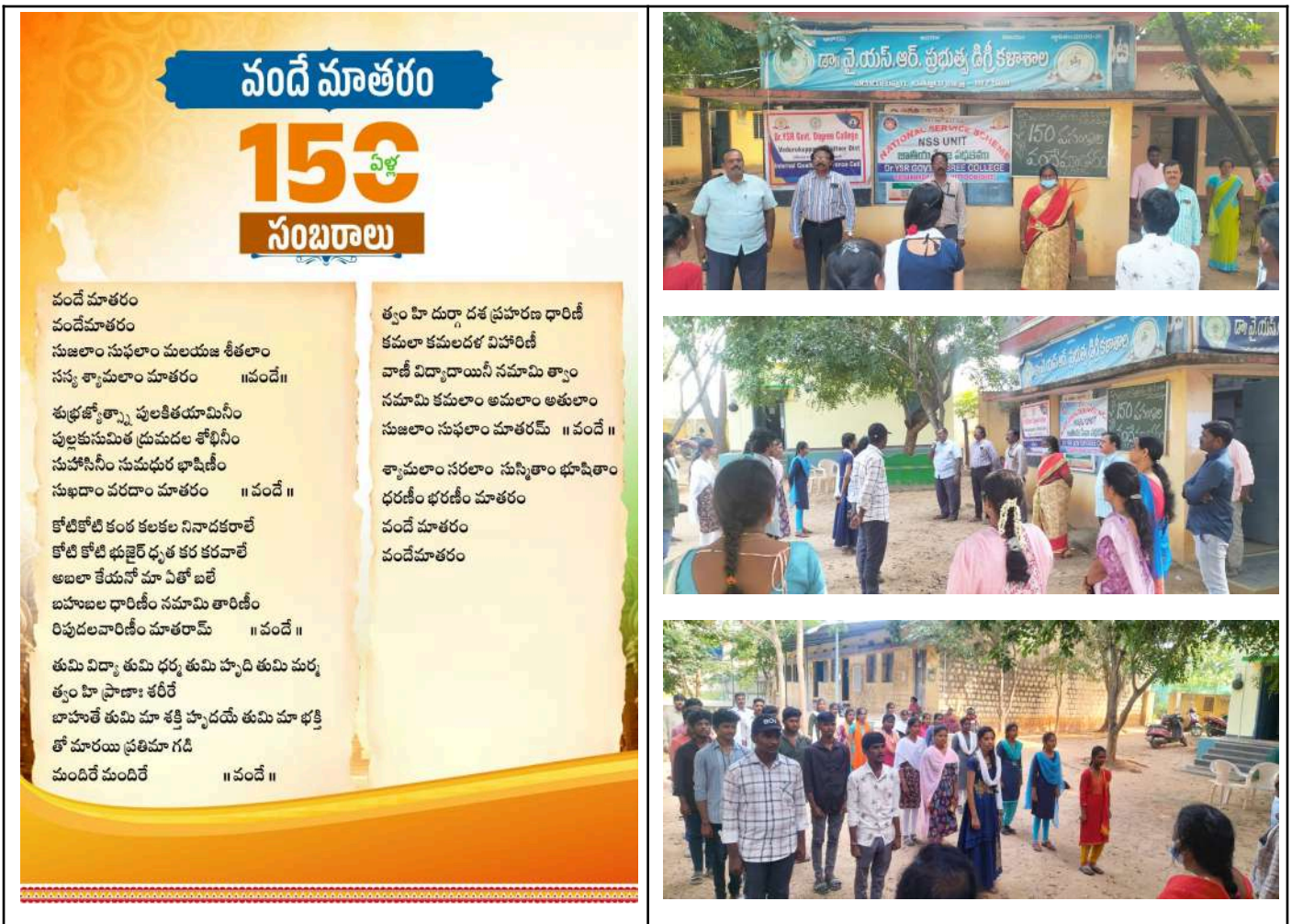
Fig: Vandhematharam celebrations

'Vandhe' is more than just an event; it's a powerful reminder of how strong we are when we stand together. Thank you to everyone who participated and helped make this year's celebration an unforgettable success!