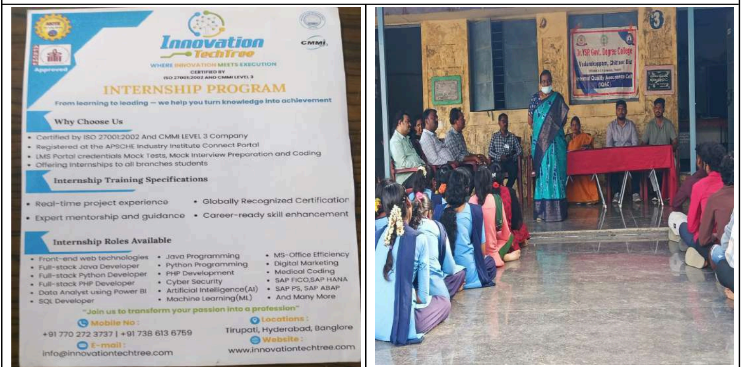
Fig: Innovation TechTree Company