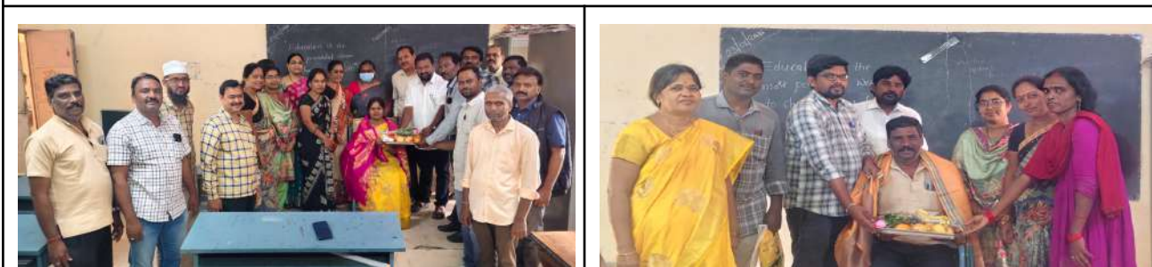
Fig: Felicitations on 1st January