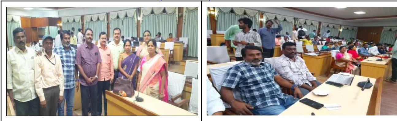
Fig: BOS meeting attended on 20-1-2026 at SVU Tirupati