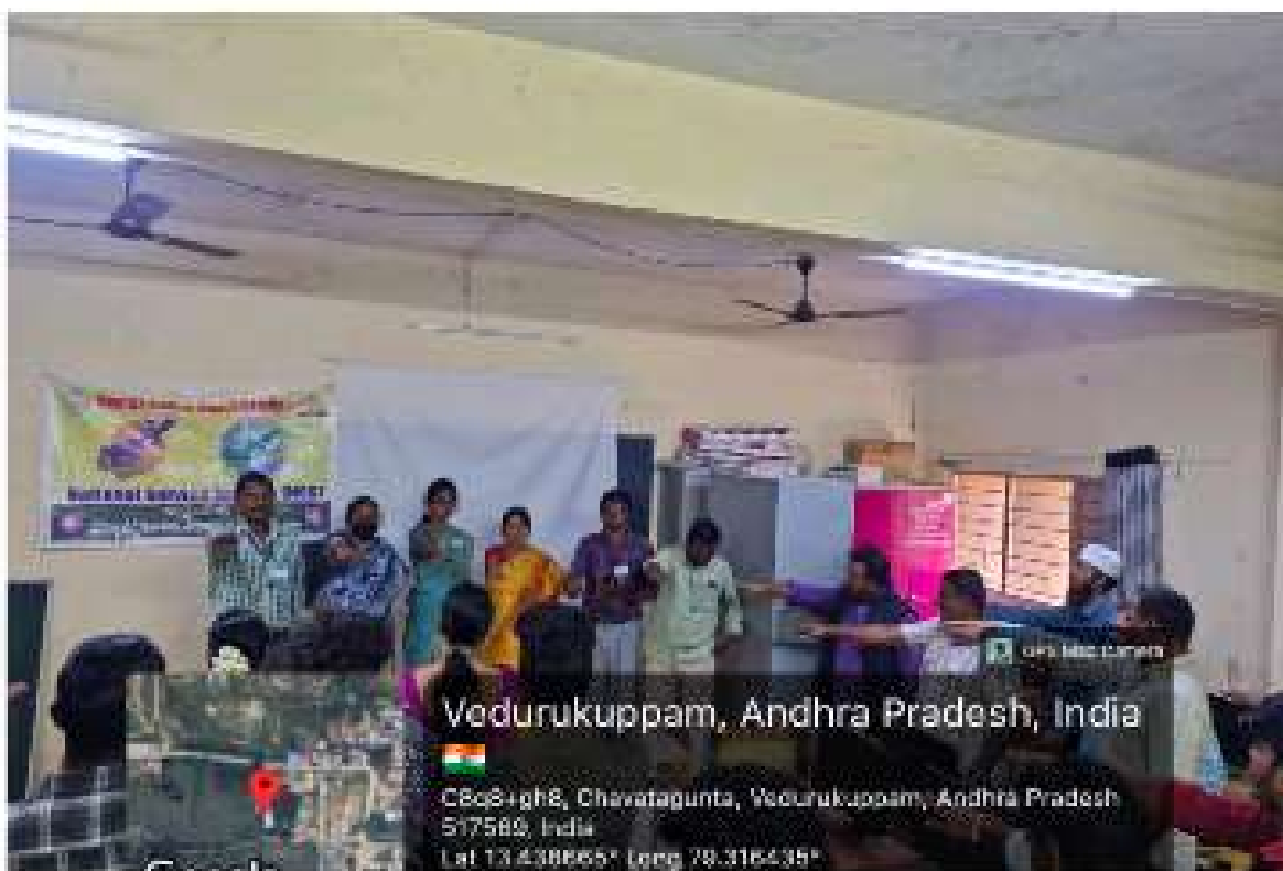
Vedurukuppam, Andhra Pradesh, India

C8c8+gh8, Chevatagunta, Vedurukuppam, Andhra Pradesh 517560, India Lat 13.438665° Long 78.316435°